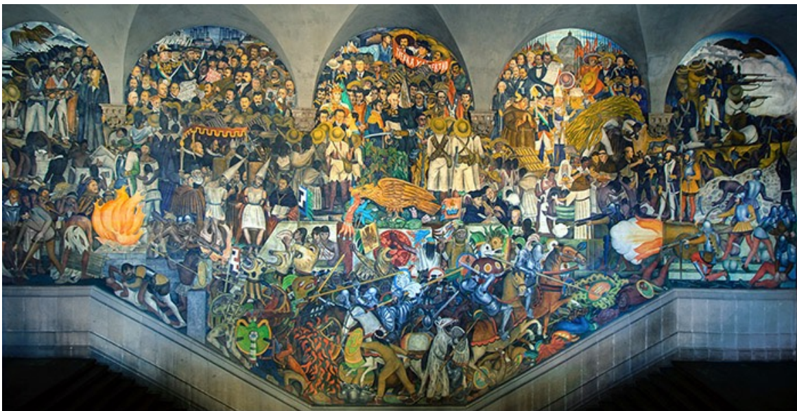
Murale de Diego Rivera, au Palacio Nacional (Mexique), 1929-30

L'art identitaire, qu'il soit individuel ou collectif, est donc bien plus qu'une expression esthétique. C'est un outil d'émancipation, de mémoire et de dialogue, qui nous rappelle que la diversité et l'unicité de chaque identité sont des richesses inestimables.