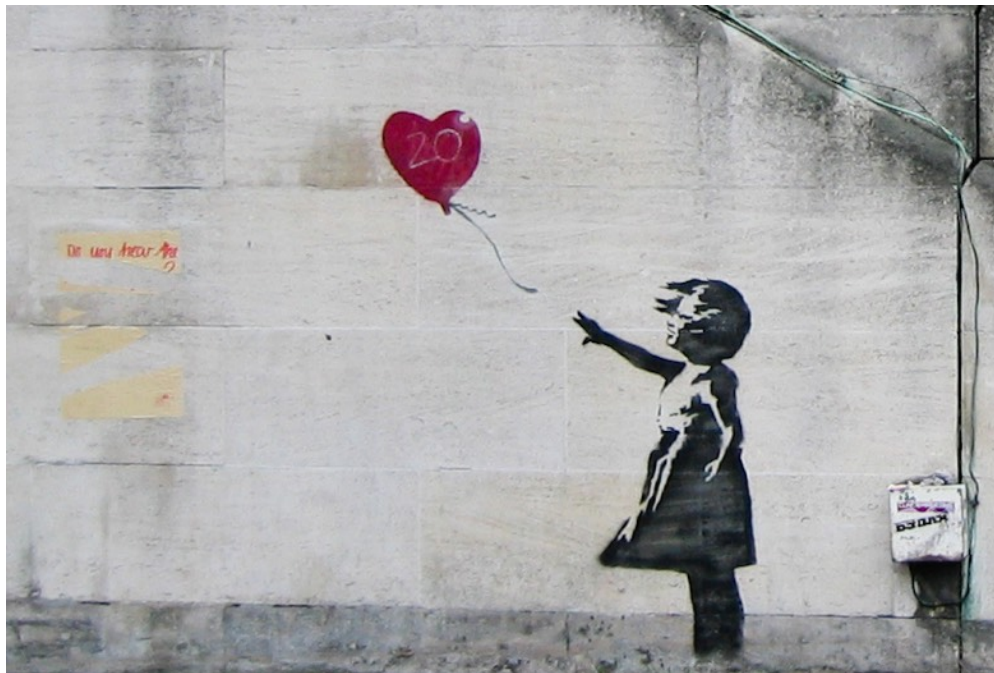
Girl with Balloon - œuvre de Banksy - Waterloo Bridge, South Bank, Londres, 2022

Banksy représente une figure iconique de l'art contemporain et du street art, mêlant provocation et réflexion dans chacune de ses créations.