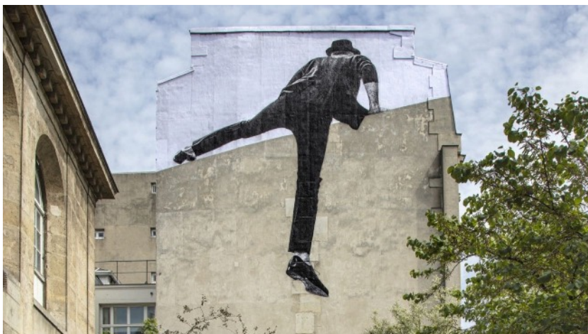
Œuvre de JR située à Paris